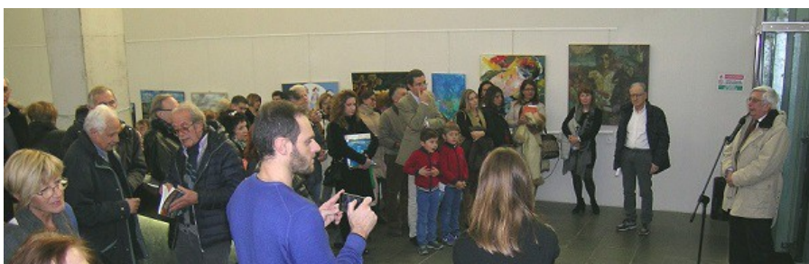
Edizione 2015 Inaugurazione al Galata Museo del Mare